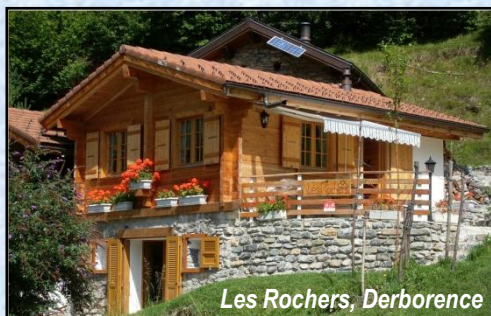
Les Rochers, Derborence

Pour tout complément d'informations ou pour une réservation, nous vous remercions d'avance de bien vouloir nous contacter aux coordonnées ci-dessous :